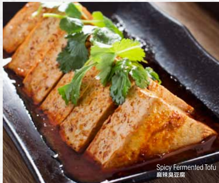
Spicy Fermented Tofu 麻辣臭豆腐